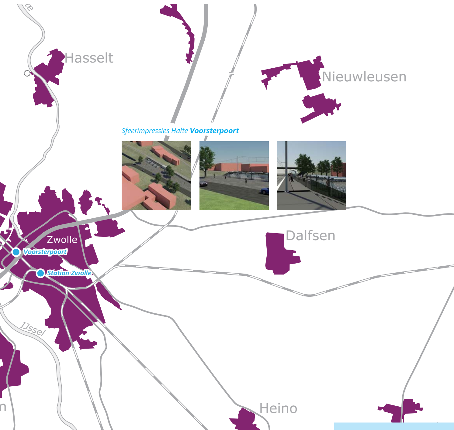
Sfeerimpressies Halte Voorsterpoort