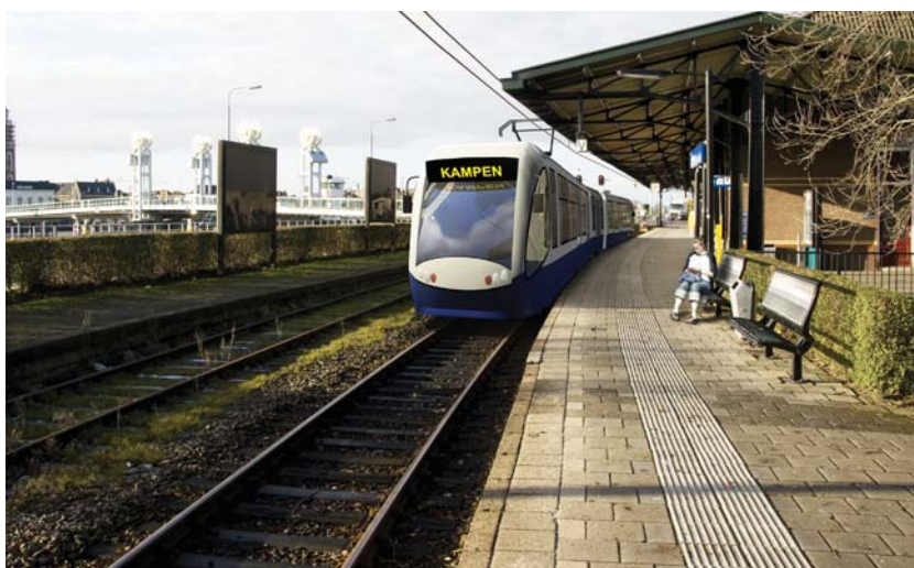
Animatie Regiotram Zwolle-Kampen