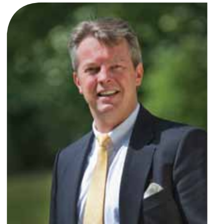
Gedeputeerde Gerrit Jan Kok

we ter inzage. Van 27 september tot en met 8 november 2011 kunt u uw zienswijze indienen. Natuurlijk organiseren we weer een informatiebijeenkomst en zijn er (extra) spreekuren. Tijdens deze bijeenkomsten geven wij een toelichting op de plannen en heeft u de gelegenheid om het ontwerp PIP te bekijken en om vragen te stellen."