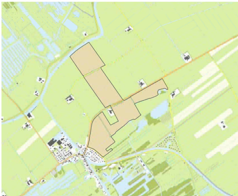
Deelgebied Verbindingszone Weerribben Rottige Meenthe.

In augustus is gestart met de planuitwerking voor beide deelgebieden. Wat houdt dat in? Voor de nieuw in te richten natuurgebieden wordt er een Milieueffectrapport (MER), een Inrichtingsplan en een Provinciaal Inpassingsplan (PIP) opgesteld. Het Inrichtingsplan geeft aan welke natuurherstellende maatregelen waar gaan plaatsvinden. Een PIP is te vergelijken met een bestemmingsplan. Hierin leggen wij bijvoorbeeld de wijzigingen van de functie of het gebruik van de gronden vast.